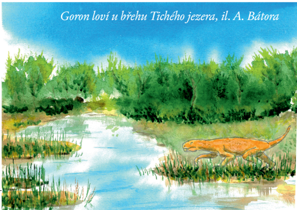
Goron loví u břehu Tichého jezera

Ilustrace měly být mnohem vzácnější, zato však jsem plánoval udělat celostránkové akvarelly. Z toho ale sešlo, a to nejen proto, že po tátově Knize Hjakubun jsem nenašel odvahu navrhnout ti vydání další plnobarevné publikace. Spíš jsem si uvědomil, že jsem mnohem lepší kreslíř než malíř, navíc bylo nakonec potřeba mnohem víc obrázků, než jsem původně myslel. Moje perokresby vycházejí ze stylu ilustrací, jež doprovázejí Běhounkovu dvojpovídku Ostrov draků , hodně mě taky inspirovaly geniální rytiny Františka Štorma pro Lovecraftovy sebrané spisy, a záměrně jsem se snažil odkazovat na estetiku devadesátkové fantasy a RPG produkce.